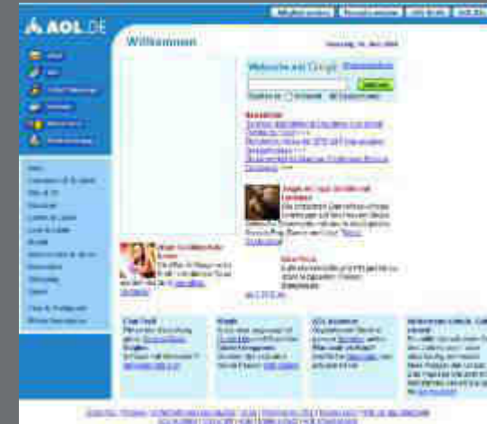
Aol.de im Jahr 2004