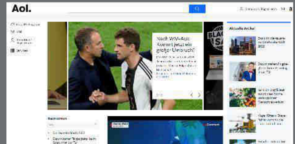
Aol.de im Jahr 2022