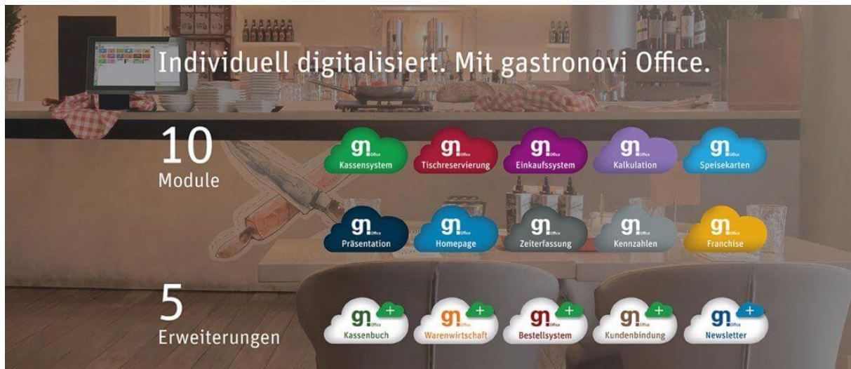
Abbildung 2: gastronovi Module (gastronovi, 2020)

Das System kann durch ein zusätzliches Kassenbuch-, Warenwirtschaft- und Bestellsystem sowie einem Modul zur Kundenbindung und der Funktion eines optionalen Newsletters erweitert werden. Die zur Verfügung gestellte Software gibt es sowohl als iOS oder Android Office App, wobei diese auch im herkömmlichen Browser verwendet werden kann. Außerdem gewährleistet Gastronovi Konformität gemäß der Österreichischen Registrierkassensicherheitsverordnung. Für den direkten Export an den Steuerberater wird eine geprüfte DATEV-Schnittstelle zur Verfügung gestellt. (gastronovi, 2020) Es werden alle Daten auf deutschen Servern, welche den EU-DSGVO-Richtlinien entsprechen, gespeichert. Im Falle einer Internetstörung wird von Gastronovi auch ein Offline-Betrieb ermöglicht.