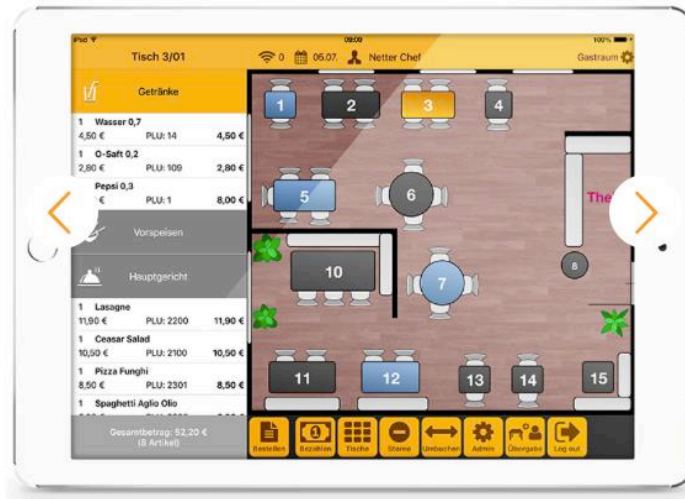
Abbildung 1: Grafischer Tischplan (GASTROFIX, 2020)